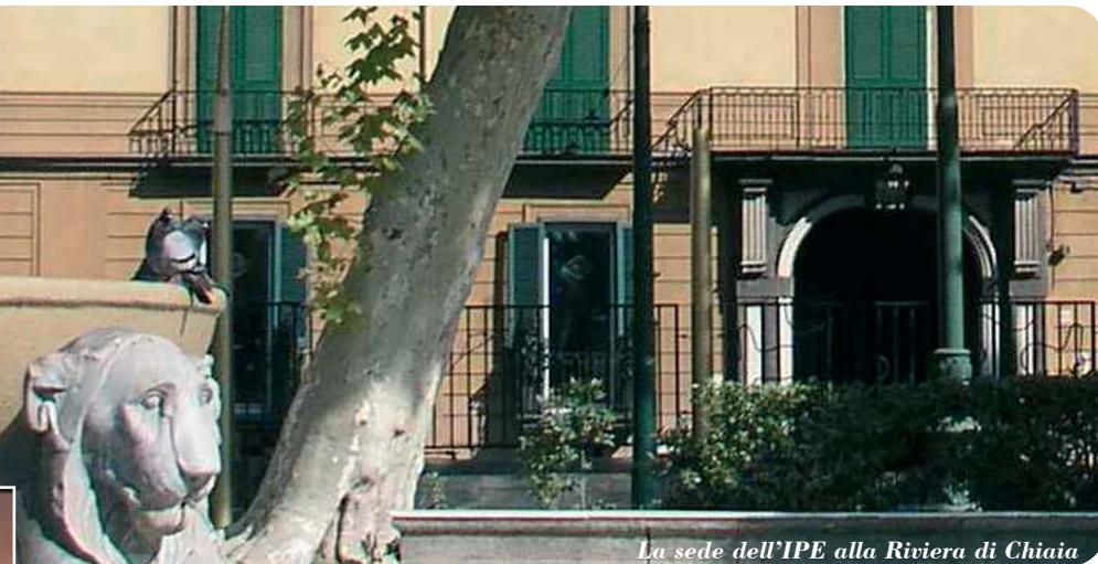
La sede dell'IPE alla Riviera di Chiavari