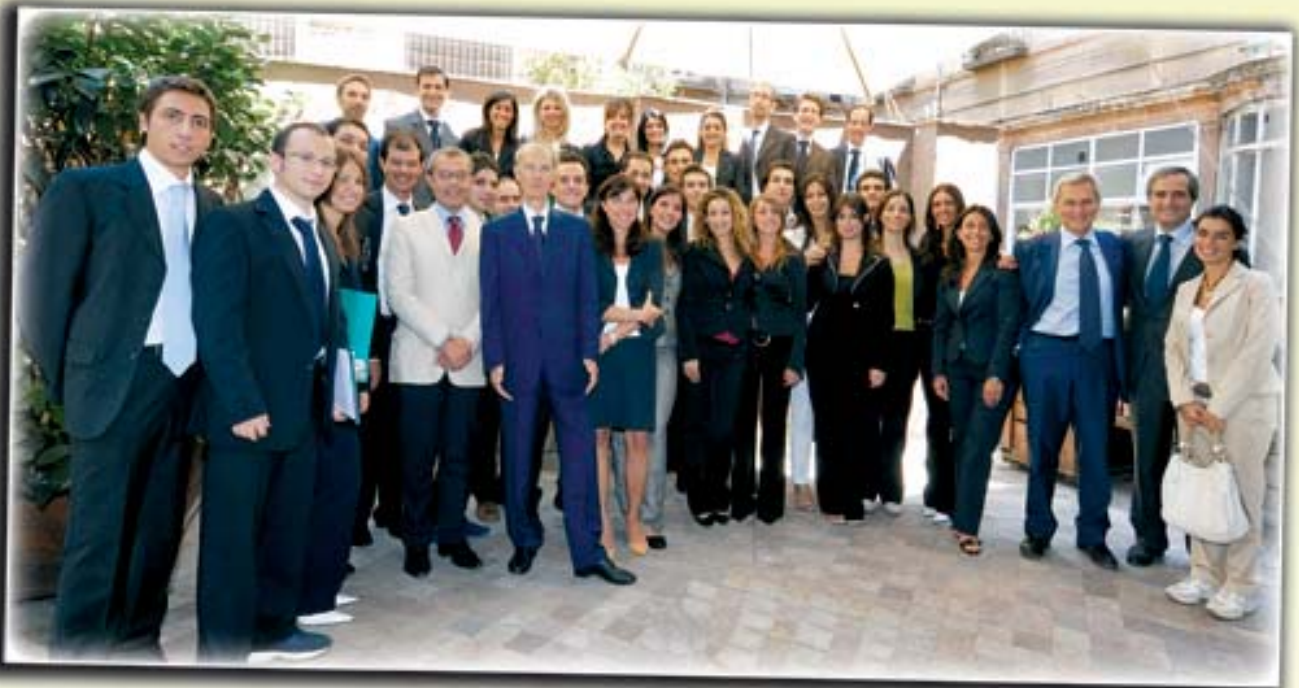
Master "Finanza Avanzata"