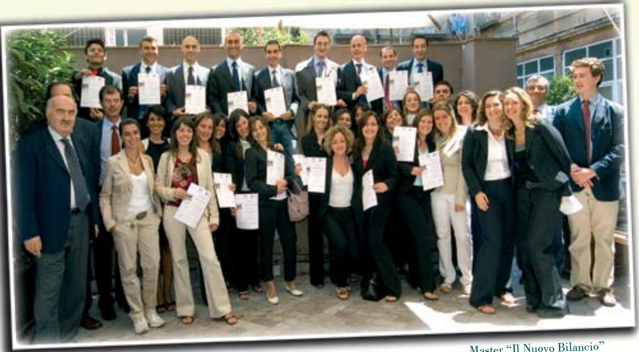
Master "Il Nuovo Bilancio"